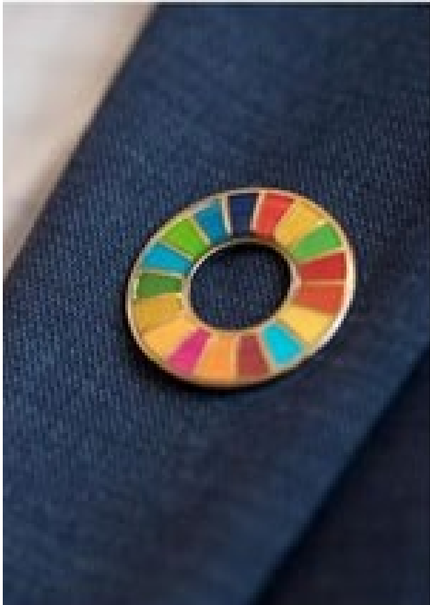
Kan kjøpes i FN-butikken (UN Web Shop)