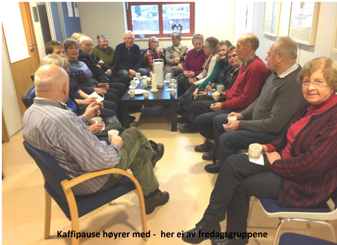
Kaffipause hører med - her ei av fredagsgruppene