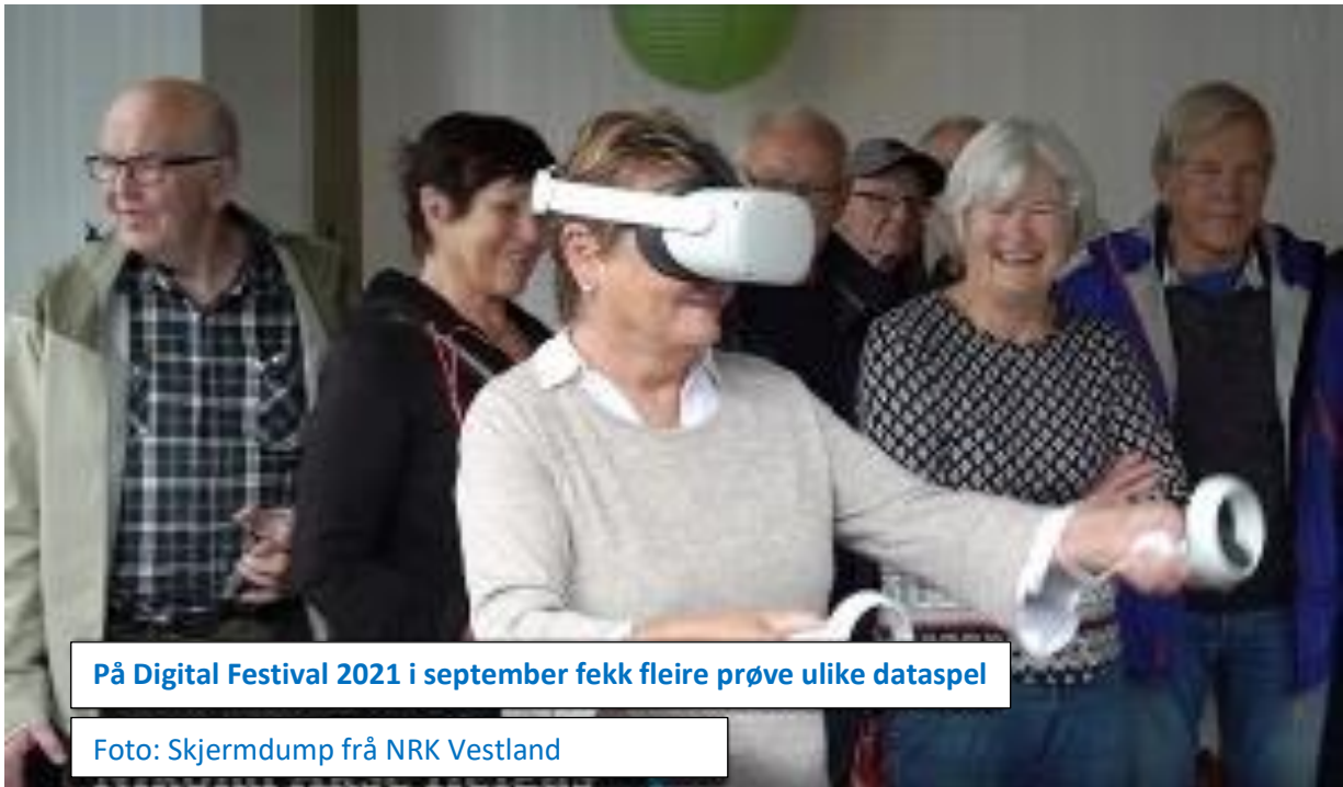
På Digital Festival 2021 i september fekk fleire prøve ulike dataspel