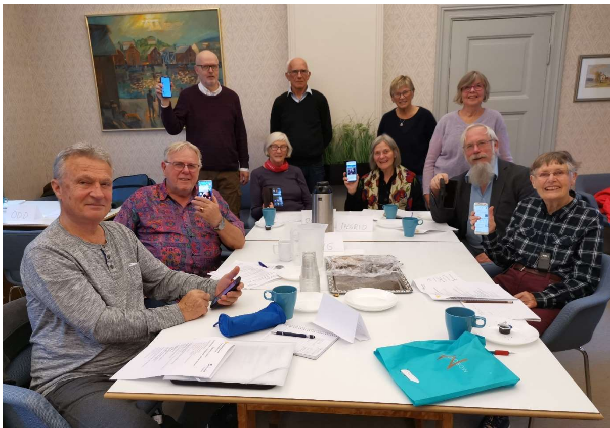
Deltagere og veiledere på datastue i Trondheim.