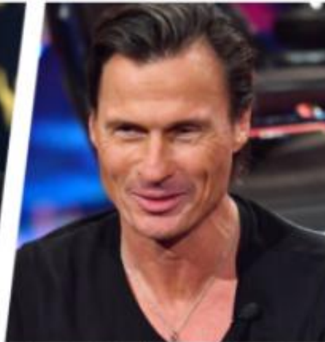
Petter Stordalen avslører en ny hemmelig investeringsmåte som har gjort hundrevis av nordmenn veldig rike